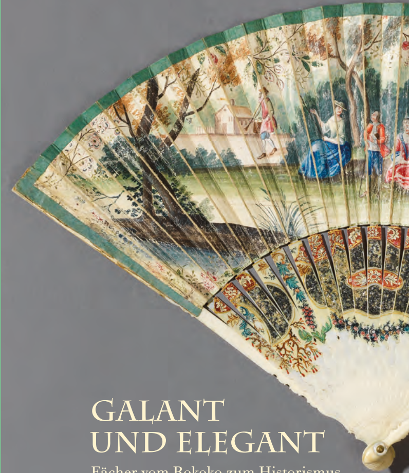
Abb. vorne: Faltfächer, Frankreich, um 1740 (Stäbe: Elfenbein; Blatt: einfach montierte Schwanenhaut, Gouschemalerei), Vorderseite, Mainfränkisches Museum Würzburg