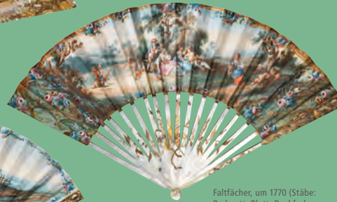
Faltfächer, um 1770 (Stäbe: Perlmutter; Blatt: Deckfarben- und Goldmalerei auf doppelt montiertem Papier), Vorder- und Rückseite, Mainfränkisches Museum Würzburg