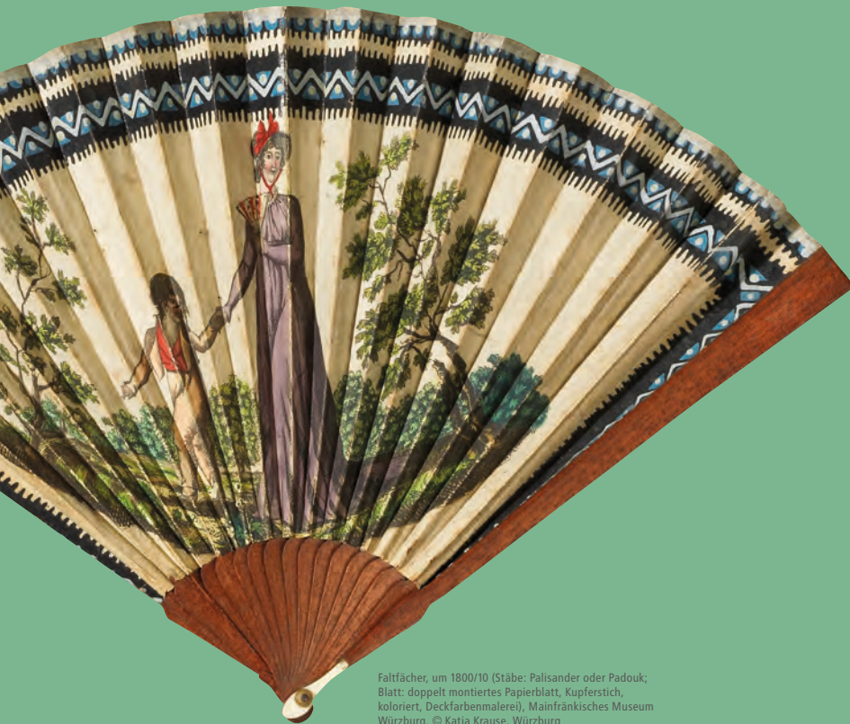
Faltfächer, um 1800/10 (Stäbe: Palisander oder Padouk; Blatt: doppelt montiertes Papierblatt, Kupferstich, koloriert, Deckfarbenmalerei), Mainfränkisches Museum Würzburg

11–17.30 Uhr Offenes Werkstattangebot Bastelt mit uns einen Engel im Fächerkleid!