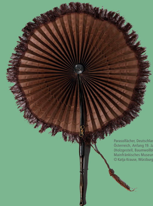
Parasolfächer, Deutschland oder Österreich, Anfang 19. Jahrhundert (Holzgestell, Baumwollblatt), Mainfränkisches Museum Würzburg, © Katja Krause, Würzburg

Fächergeflüster. Die Sprache der Zeichen Leitung: Herma Harloff 28.11., 12.12.2015, 23.01.2016