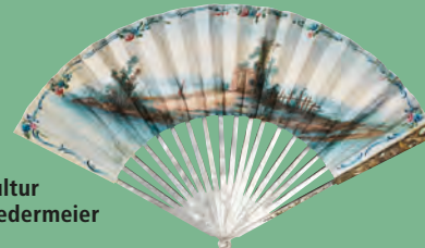
Faltfächer, um 1770 (Stäbe: Perlmutter; Blatt: Deckfarben- und Goldmalerei auf doppelt montiertem Papier), Rückseite, Mainfränkisches Museum Würzburg