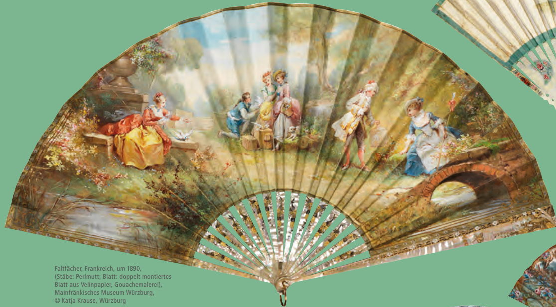
Faltfächer, Frankreich, um 1890, (Stäbe: Perlmutter; Blatt: doppelt montiertes Blatt aus Velinpapier, Gouachemalerei), Mainfränkisches Museum Würzburg